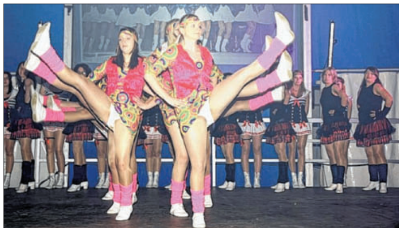
Die hübschen Gardemädchen sind beim TVT Tradition seit 25 Jahren.

Vor knapp 50 Jahren etablierten sich die Tischtennispieler im Verein – im Dunkeln, mit Schwarzlicht und raffinierten Leuchteffekten beeindruckten sie am Freitag die Besucher mit kunstvollen Ball-Tricks, Ballwechseln in Zeitlupe oder Tischtennis-Spielen ohne Partner.