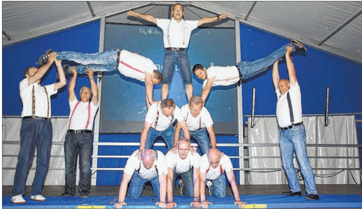
Die Männerturner beeindruckten mit einer schön gebauten Pyramide.